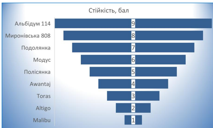
Рис.1 – Сорти-еталони морозостійкості сортів озимої м'якої пшениці (за 9-ти бальною системою)

сорту відповідну групу стійкості (рис. 2). Результати визначання заносять у робочі журнали установленної форми.